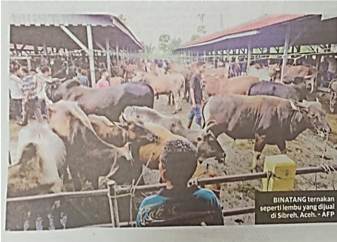
BINATANG ternakan seperti lembu yang dijual di Sibreh, Aceh.