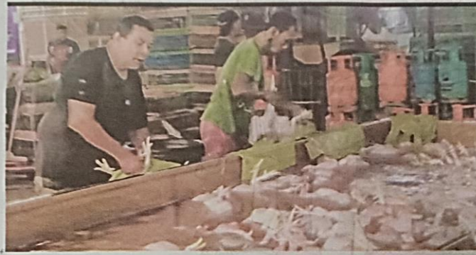
BEBERAPA pekerja Jukee Ayam sedang membersihkan ayam sebelum diedarkan ke empat buah negeri yang mengalami kekurangan bahan mentah berkenaan sejak minggu lalu.

Mampu atasi kekurangan sehingga 30,000 ekor